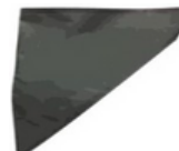
Aplicador de cola