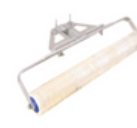
Rolos de suporte